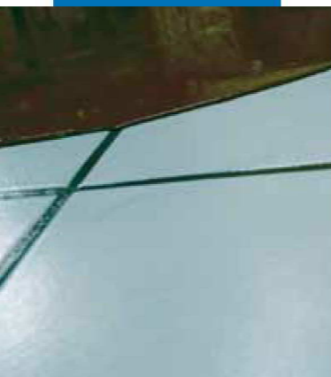
Detail zur Verarbeitung von Ultraplän auf dem vorab grundierten Keramikbelag