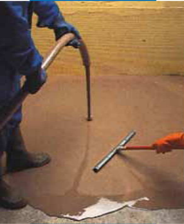
Maschinelles Verarbeiten von Ultraplan