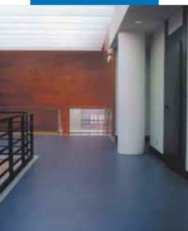
Beispiel einer Linoleumverlegung auf einem mit Ultraplan gespachtelten Untergrund. Monzon - Konservatorium - Spanien