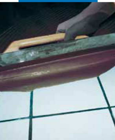
Verarbeitung von Ultraplan mittels Glättkelle auf vorhandenem Keramikbelag nach vorheriger Grundierung