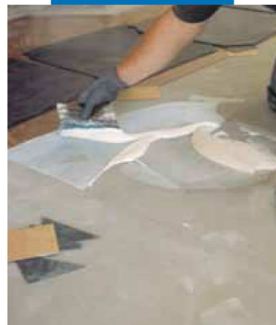
Beispiel einer PVC-Intarsienverlegung auf Ultraplan. CD2 - Mailand – Italien