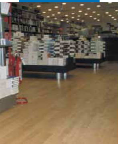
Beispiel einer Fertigparkettverlegung auf einem mit Ultraplan ausgeglichenen Untergrund. Messagerie Musicali - Rom - Italien