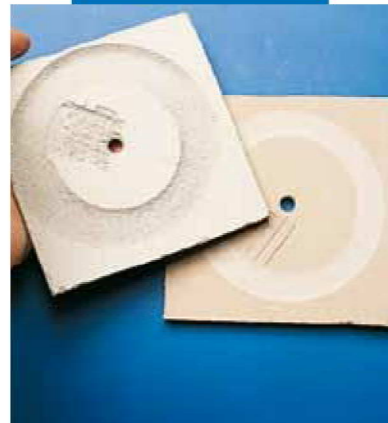
Prüfung des Verschleissverhaltens (Taber) nach 200 Umdrehungen auf Ultraplan (rechts) und auf herkömmlicher Bodenspachtelmasse