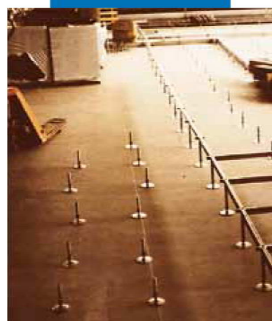
Ausgleich von Unebenheiten einer Betondecke vor der Herstellung eines Doppelbodensystems